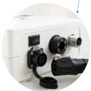
Interfaz de alimentación del controlador