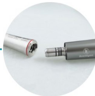
Conecte la tubería de la pieza de mano