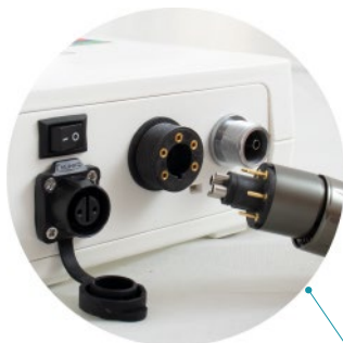
Conexión de potencia del motor