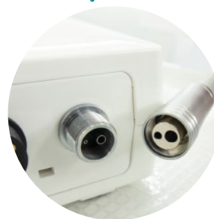
Conectar a la entrada de agua de Unidad Dental