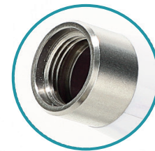
Interfaz roscada Instalación y remoción rápida