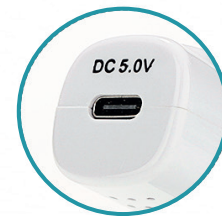
Batería: 3.7V Alimentación: DC 5.0V