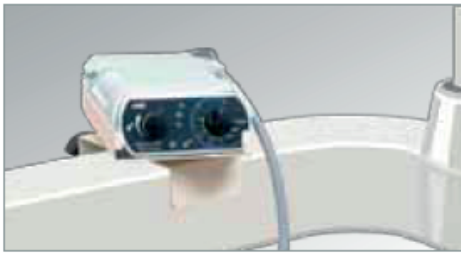
Con soporte (opcional) sobre el brazo del panel de instrumentos